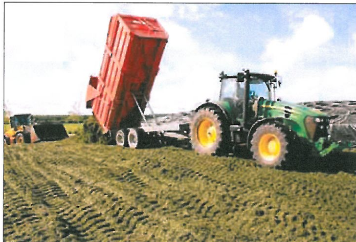
En tredjedel af de store landbrug forventer at øge investeringerne i 2012.

Efter et par meget vanskelige år begyndte økonomien i landbruget at rette sig i 2010, og i dag er produktionen trimmet i mange landbrugsvirksomheder, som blandt andet har haft travlt med at reducere